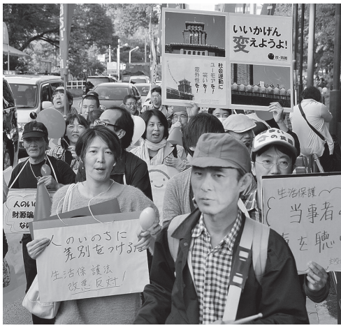
2012年10月20日、東京都港区での生活保護改善反対などを訴えるデモ

憲法25条の「誰もが人間らしく生きる権利」(生存権)とそれを保障する国の責任を放棄しようとしています。